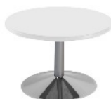
Table basse ronde

Disponible en noir ou en blanc* REF : HD01 55 €