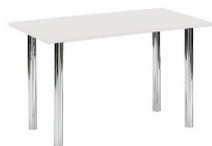
Table rectangulaire 120x70 cm.

Disponible en noir ou en blanc* REF : CVOL11 30 €