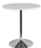
Table haute ronde Diam 70 cm.

Disponible en noir ou en blanc* REF : HA01 58 €